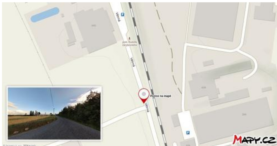
Obrázek č. 6 Skutečná poloha