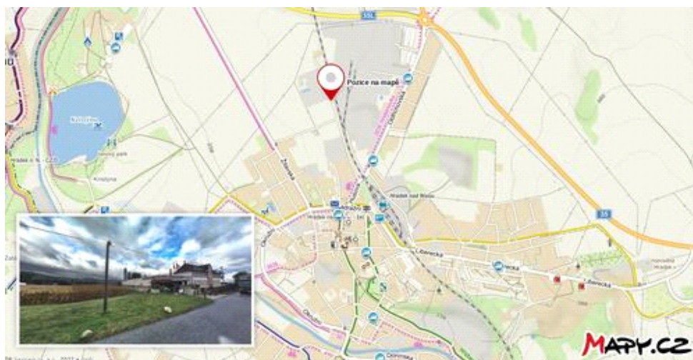
Obrázek č. 7 Poloha podle mapy